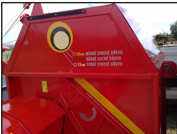
Obrázek 2: Fotografie funkčního vzorku – štípací stroj palivového dřeva KRAPED.