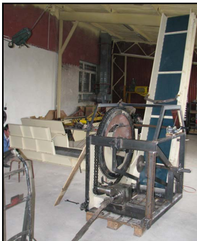
Obrázek 3: Štípací stroj palivového dřeva KRAPED – fáze výroby.