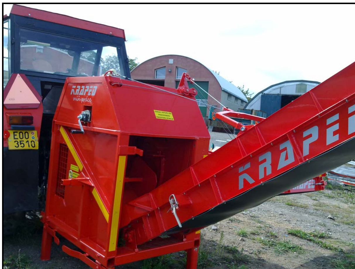
Obrázek 1: Fotografie funkčního vzorku – štípací stroj palivového dřeva KRAPED.